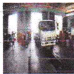
Foto Belakang Image Rear